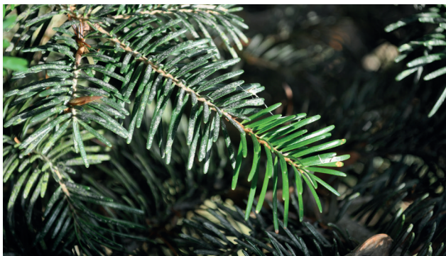
Hvide døde alger